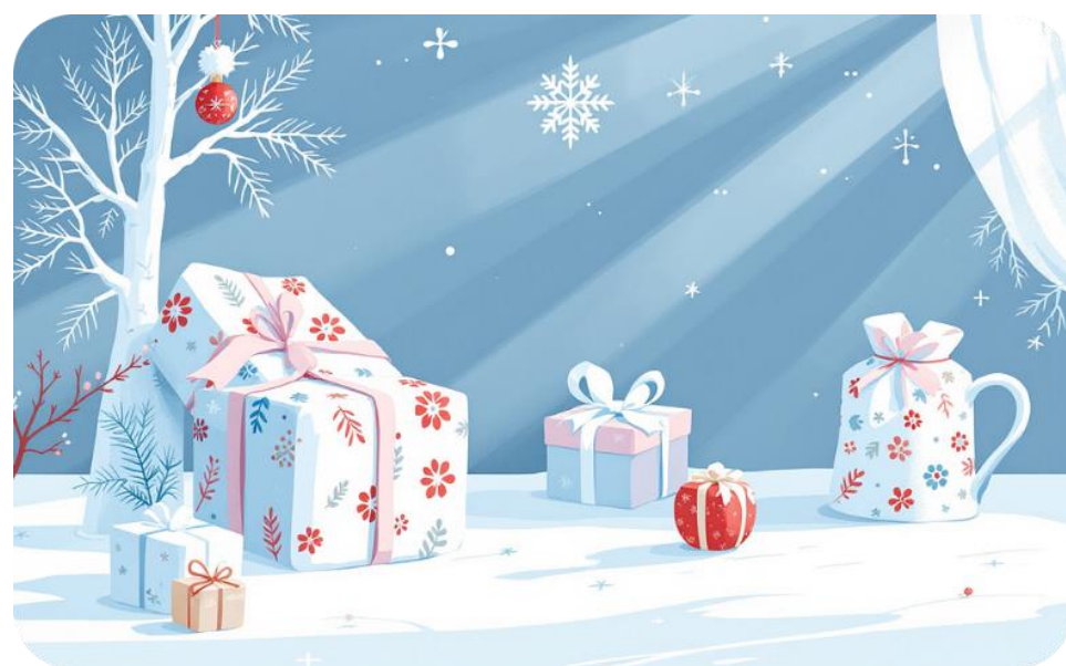
Подарки и угощения