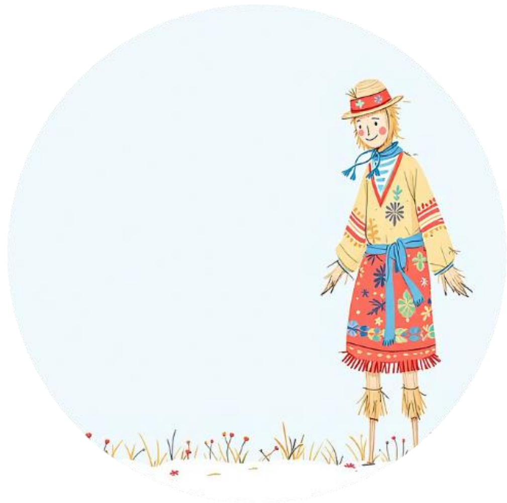
Создание чучела Масленицы