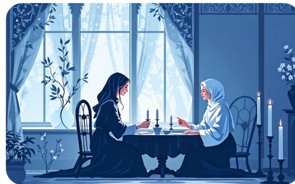
Посиделки и гадания