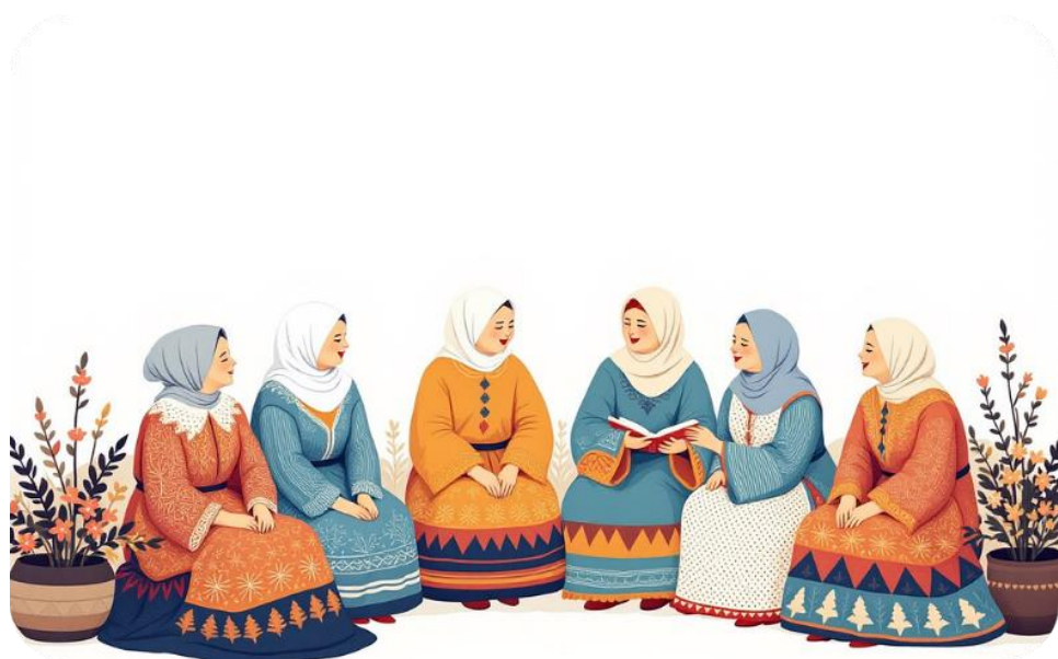
Приглашение сестёр мужа