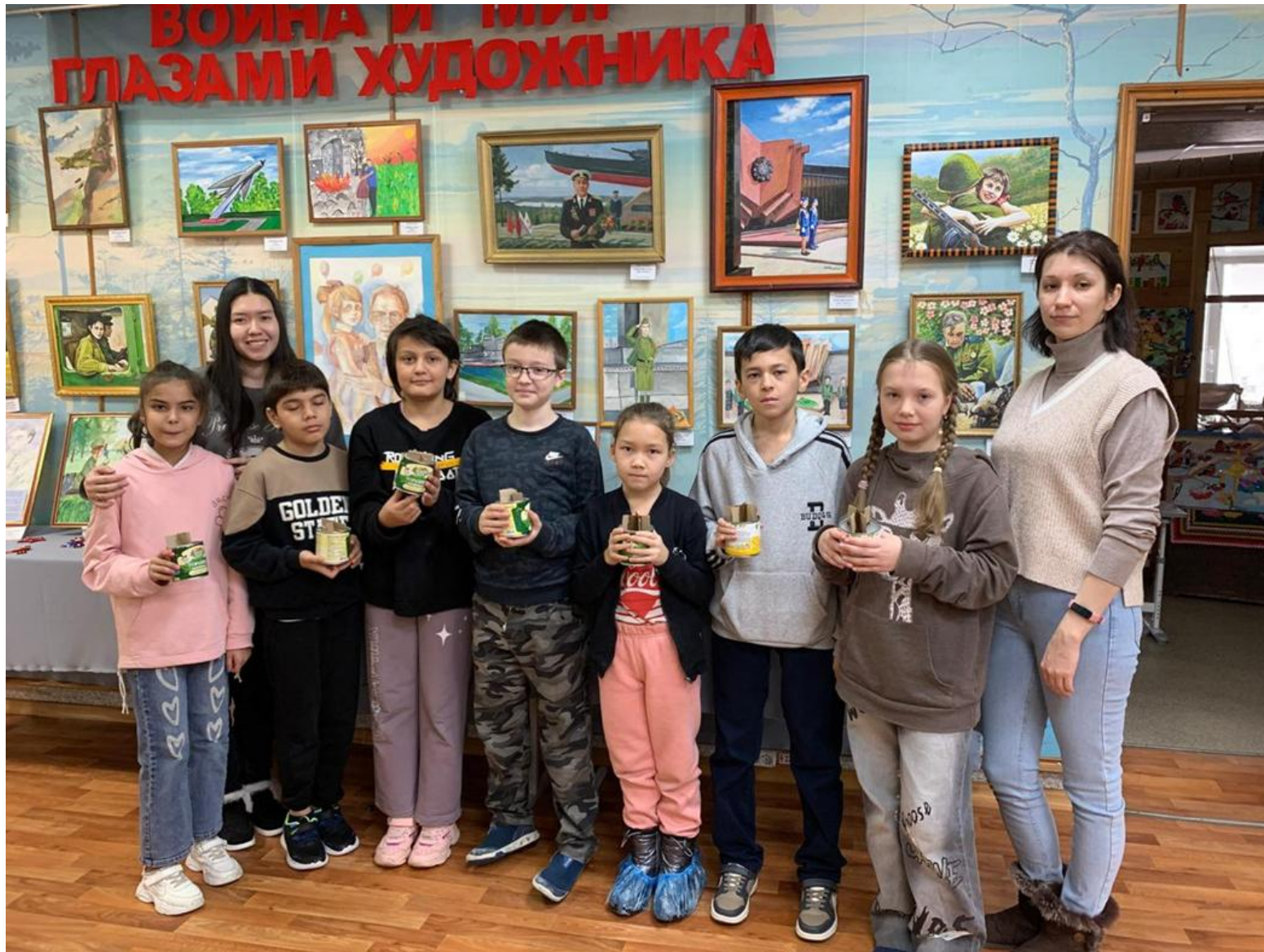
МАУ ДО ДЮЦ «Поиск»