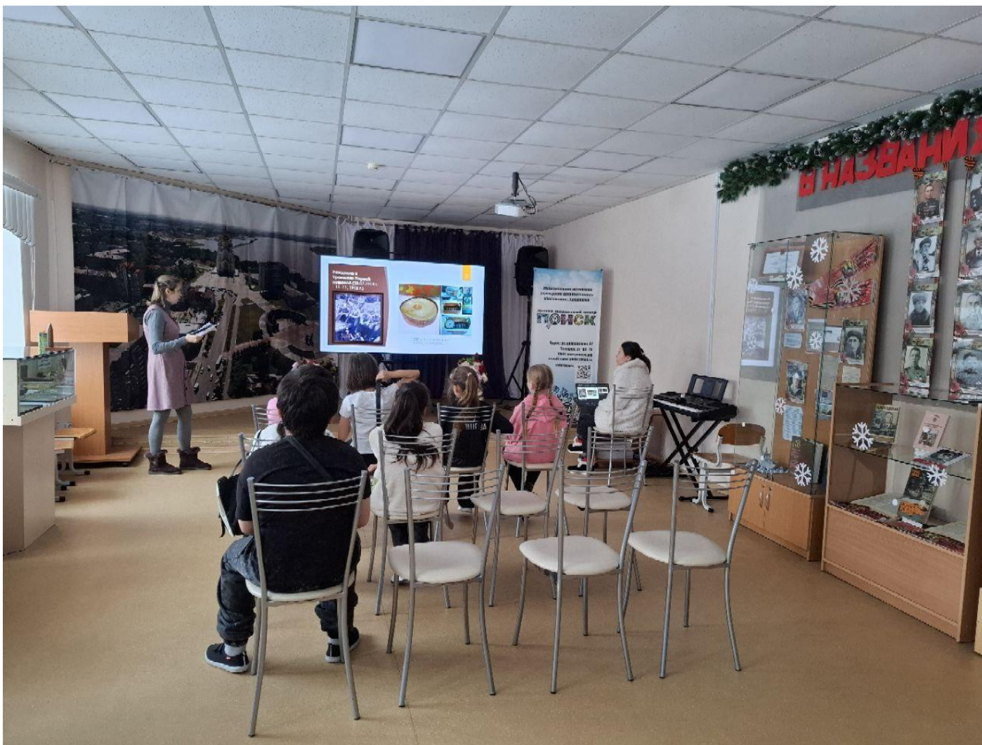
МАУ ДО ДЮЦ «Поиск»