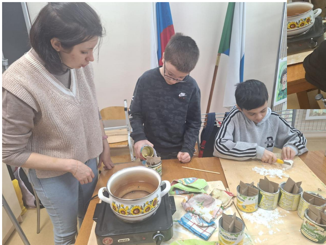
МАУ ДО ДЮЦ «Поиск»